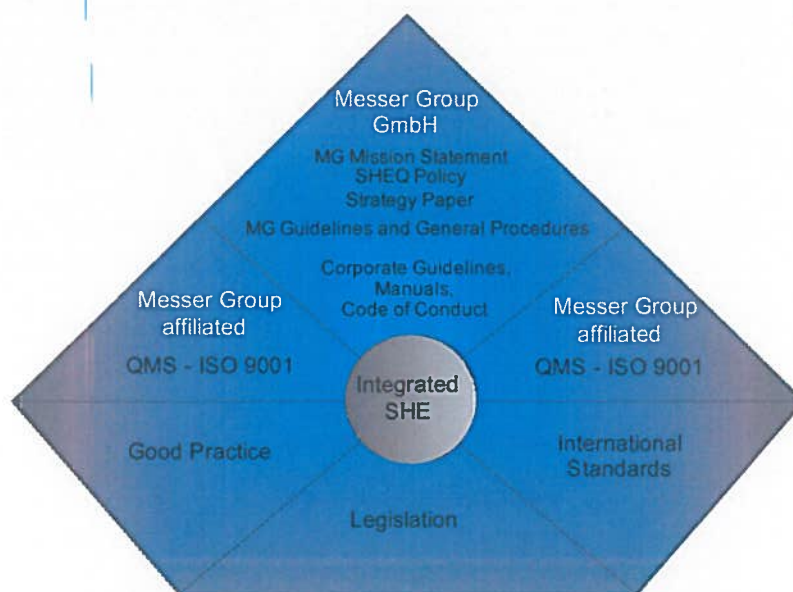
4 Integrirani QMS i Messer dokumentna hijerarhija Q-dokumenata Messer Grupe

Ti dokumenti su pripremljeni u Messerovom holdingu Messer Group GmbH i važeći su za sve srodne tvrtke.