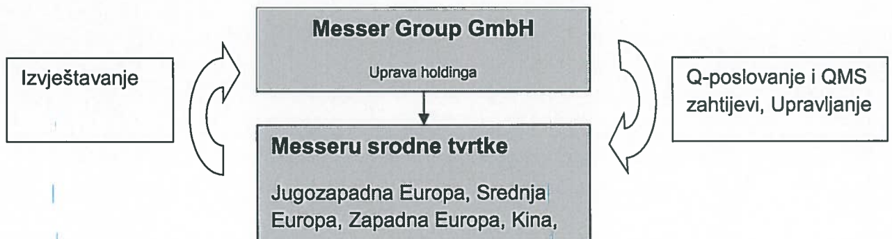
Slika 1: Messer Group Holding – struktura

Messer Grupa je strukturirana kao holding sa aktivnim tvrtkama (podružnice, pridružena društva) u Europi, Alžiru, Kini, Novom Zelandu, Vijetnamu i Peruu. Sve aktivne tvrtke Messer Grupe su srodne Messer Group GmbH , koja služi kao uprava holding za cijelu Messer Grupu (slika 1)